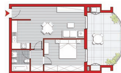
tipologia con 1 camera