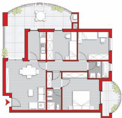
tipologia con 3 camere

Queste sono solo alcune delle tipologie disponibili: contattateci per avere maggiori informazioni su tagli e dotazioni.